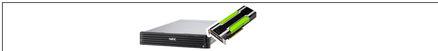
図 1、検証接続構成図（構成 A）

構成 B : サーバに ExpEther ボード（40G）を 1 枚搭載し、40G スイッチ・ケーブルを介して ExpEther I/O 拡張ユニット（40G）に接続する。I/O 拡張ユニットには GPU を 1 枚搭載する。